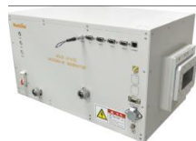
2.45GHz 1.5kW (GaN)