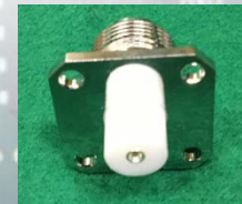
アンテナ用 コネクタ