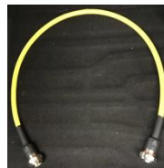
ハイパワーケーブル 1kW/2kW