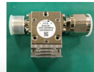
2.45GHz 300W Isolator