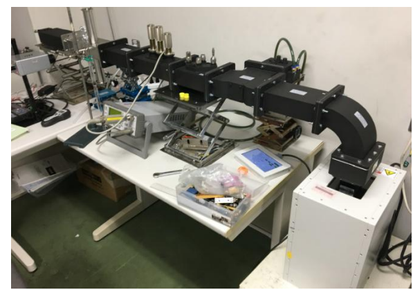
2.45GHz 1.5KWシングルモード加熱装置