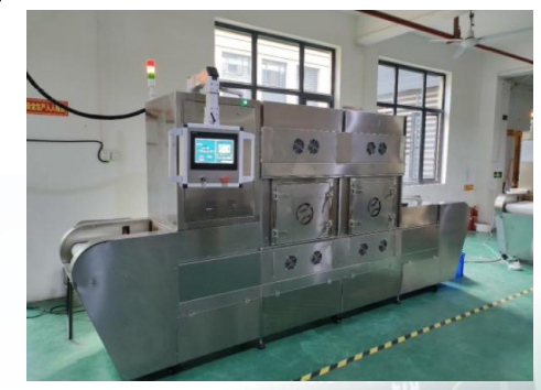
2.45GHz 24kW コンベア式